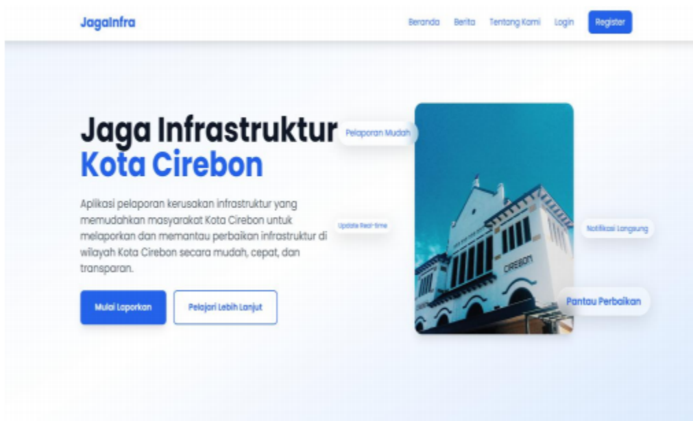
Gambar.2 Beranda Website Jagainfra