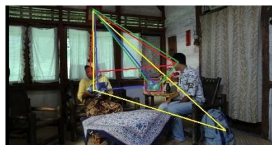
Gambar 14b FS Lakan melihat foto (Video Image LAKAN, 2016)

Pada scene ini komposisi segitiga dapat di bentuk menjadi 2 bagian yaitu melalui blocking dan setting, komposisi segitiga pada gambar pertama melalui blocking yang di tandai dengan garis berwarna kuning antara Lakan , Nurbaya dan foto Bahar , serta garis yang berwarna merah terdapat komposisi segitiga antara Lakan , foto Bahar dan foto keluarga. Pada gambar yang kedua terdapat komposisi segitiga menjadi 2 bagian dengan blocking dan setting, pada gambar yang bergaris merah menggambarkan melalui blocking antara Lakan , nurbaya dan foto Bahar , serta melalui setting yang terdapat pada garis berwarna biru antara mukena , foto Bahar dan foto keluarga, dan garis yang berwarna kuning menunjukan komposisi segitiga melalui setting antara foto Bahar , mukena dan tas Lakan . Komposisi segitiga ini bertujuan untuk mencari keadilan pembunuh ayah Lakan . Sedangkan pada pencahayaan menggunakan pencahayaan soft , tujuannya memberikan suasana yang damai dan tenang.