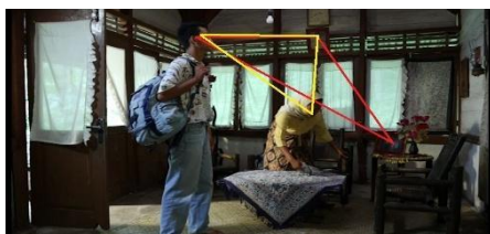
Gambar 14a FS Lakan melihat suasana rumah (Video Image LAKAN, 2016)

Dalam konteks ini, relasi antara Lakan , Nurbaya , dan foto Bahar membentuk sirkulasi pandangan yang menahan perhatian penonton sekaligus mengikat makna pada ingatan dan ketidakadilan masa lalu. Penata gambar adalah orang yang bertanggung jawab atas perencanaan dalam perekaman gambar. Dalam merencanakan perekaman gambar, penata gambar melakukan interpretasi berdasarkan skenario dan berkomunikasi aktif dengan sutradara. Mascelli menjelaskan bahwa komposisi segitiga mampu “ hold the viewer’s eye within the frame ” karena mata secara alami mengikuti hubungan antar titik (Mascelli, 2016). Dalam Scene 7 ini menceritakan tentang Lakan melihat keseluruhan ruangan. Rumah sederhana tanpa banyak perabotan rumah, hanya ada kursi rotan diruang tamunya, serta pajangan foto Bahar di dinding dan foto keluarga. Lakan tersenyum dia segera menurunkan bekalnya dan duduk dikursi rotan.